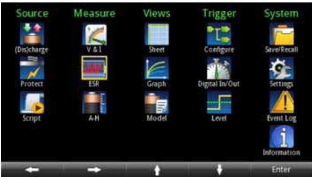
图 6. 电池测试菜单。

高亮度 4.3 英寸 TFT 显示器用大的易读字符显示电压、电流和安时读数、源设置及许多其他设置。基于图标的主菜单提供了用户可以控制和设置的所有功能，可以快速进入源设置、测量设置、显示格式、触发选项和系统设置。菜单简短，所有选项容易查找且描述清楚，可以使用导航轮、数字键盘或软键迅速设置测试参数。许多设置参数，如电压和电流设置，可以直接从主屏输入；不复杂的测试无需进入主菜单进行设置，就可以在主屏上使用软菜单进行调节。不管测试要求简单还是复杂，Series 2281S 电源都为设置所有要求的参数提供了一种简便方式。