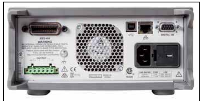
图 7. 2281S 后面板。

用户可以选择前面板端子或后面板端子，增强连接的灵活性。为实现最大电压精度，4 线远程传感保证编程的输出电压是应用到负载的实际电平。此外，它监测传感线路，检测其中的任何中断。这些功能保证了可以迅速识别和校正任何生产问题。可以通过内置 GPIB、USB 或 LAN 接口控制 Series 2281S 电源。USB 接口符合测试测量系统标准 (TMC)。符合 LXI 核心标准的 LAN 接口支持远程控制和监测 Series 2281S 电源，因此测试工程师可以一直接入电源，查看测量数据，即使电源和测试系统位于不同的两大洲。