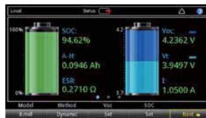
图 2. 电池仿真器主屏。