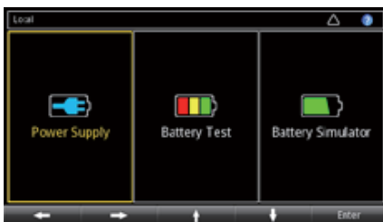
图 1. Series 2281S 启动屏幕。

2281S 采用线性调节，保证低输出噪声和杰出的负载电流测量灵敏度。采用高清彩色晶体管 (TFT) 屏幕显示与测量有关的各种信息。软键按钮和导航轮与 TFT 显示器相结合，提供了一个浏览方便的用户界面，加快仪器设置和操作。此外，内置绘图功能可以监测各种趋势，如漂移。这些功能提供了台式和自动测试应用要求的灵活性。此外，2281S 提供了列表模式、触发和其他速度优化功能，最大限度地减少自动测试应用中的测试时间。