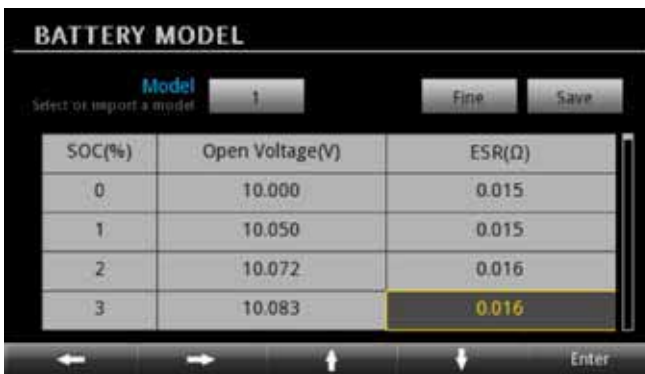
图 5. 电池模型。