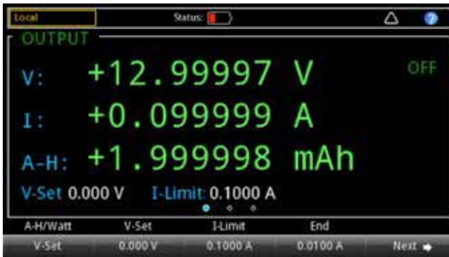
图 4. 电池测试显示。

在测试后，可以根据电池充电过程的测量结果生成电池模型。可以以 CSV 文件格式编辑、创建、导入或导出电池模型。