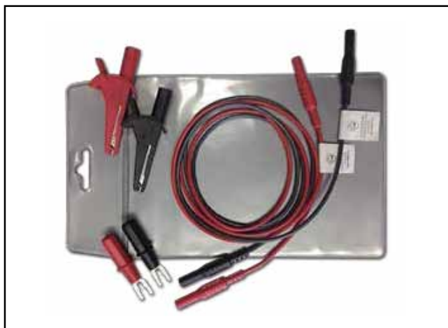
Model 2280-TEST-LEAD: 电源测试线套件, 1000V, 20A 额定值: 包含 122 厘米 (4 英尺) 电缆, 平接线片适配器, 鳄鱼夹。